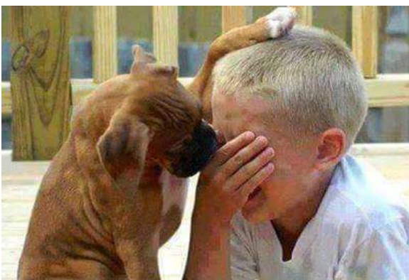
Dogs can sense sadness in their owners !!

Het financiële overzicht 2019 is op onze website gepubliceerd.