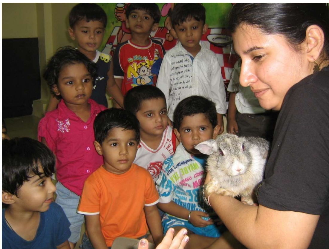
Dit worden dierenvrienden voor het leven!

Wij zijn bezig met het opzetten van een internationale website, gericht op kinderen om hen op een speelse wijze te laten zien, hoe zij het beste om kunnen gaan met hun eigen huis- of erfdieren. Maar ook hen meer informatie te geven over zwerfdieren en hoe zij hen zo goed mogelijk kunnen helpen. En in ieder geval respectvol met deze dieren zouden moeten omgaan.