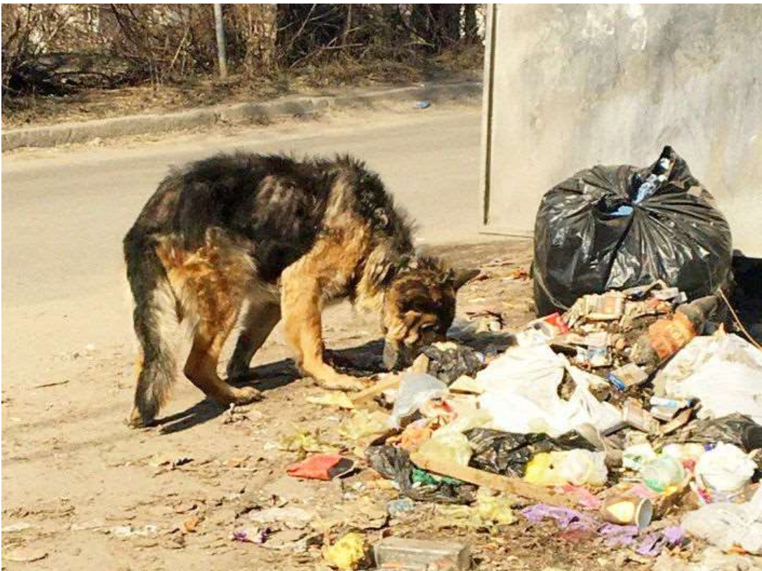
De meeste zwerfdieren zijn de hele dag bezig met eten te bemachtigen.