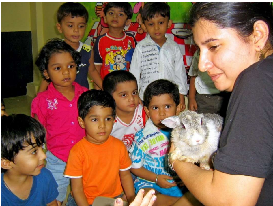
Dit worden dierenvrienden voor het leven!

Die hebben dat snel door, waarna hun aandacht voor de video's veel minder wordt omdat het niet als authentiek wordt ervaren.